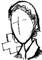
ナイティンゲール